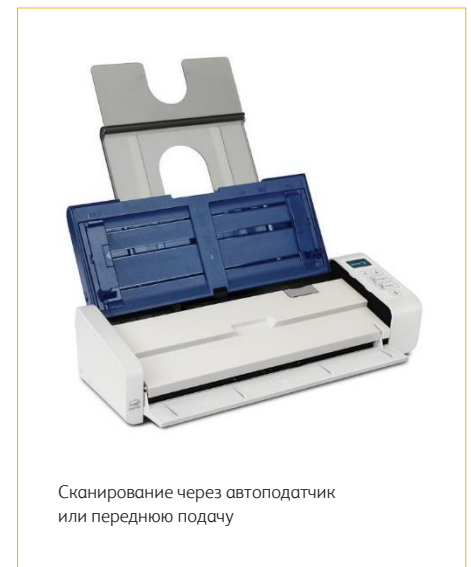
Сканирование через автоподатчик или переднюю подачу

Xerox® Duplex Portable Scanner — отличный выбор для компаний любого размера, в любой отрасли: от юридических и медицинских учреждений до страхования и финансирования. Этот сканер идеально подходит для организации и контроля критически важных бизнес-данных.