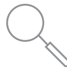
Automação da qualidade da imagem