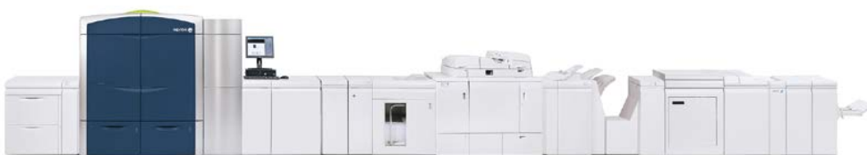
Presses couleur Xerox® 800i/1000i