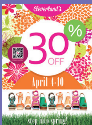
Ponto de Venda

Produzir grandes quantidades de trabalhos de grande formato era normalmente um desafio , exigindo várias impressoras e vários dias para satisfazer o pedido de um único cliente. Não admira que estes trabalhos fossem por vezes vistos como um problema. Mas com a Xerox Wide Format IJP 2000, estes trabalhos representam uma oportunidade de lucro.