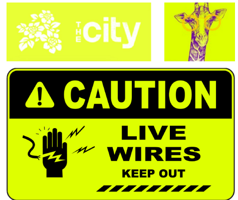
אפקטי ספוט או זרם