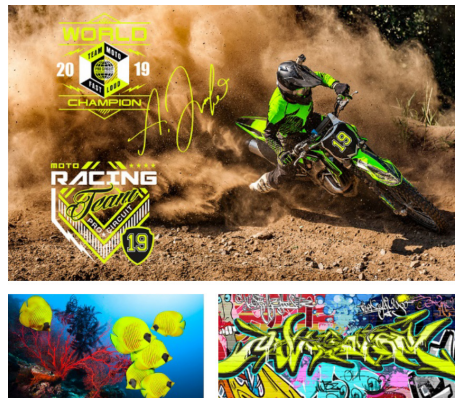
שיפורי צבע ותמונות