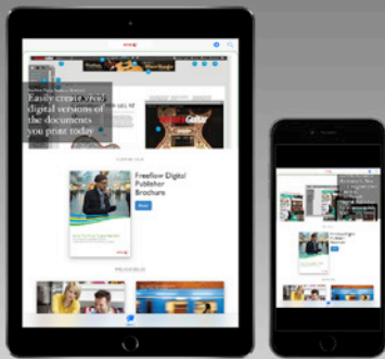
Optie 1 voor storefronts