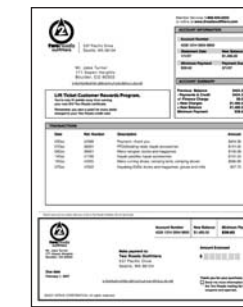
Traditioneel transactieoverzicht voor detailhandel

Bedrijven binnen de detailhandel verkopen allerlei producten. Nieuwe klanten doen hun eerste inkopen en reeds bestaande klanten komen terug voor hun favoriete handelswaar. Er moeten elke maand overzichten naar beide typen klanten worden verzonden. Dit is de perfecte gelegenheid voor cross-selling met gespecialiseerde en individuele promoties op basis van aankopen uit het verleden. Er kan extra omzet worden gegenereerd door elke klant aanbiedingen toe te sturen die op diens specifieke voorkeuren zijn afgestemd. Het promotietransactiedocument kan ook beschikbaar worden gesteld voor weergave door de klant of door de klantenservice.