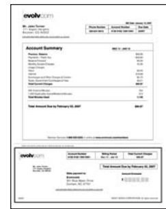
Traditioneel transactieoverzicht voor telecommunicatie

Full-service telecommunicatiebedrijven bieden services voor telefonie, internet en kabel, maar slechts weinig klanten betrekken alle services bij één en dezelfde leverancier. Er moeten elke maand overzichten worden verzonden. Dit is de perfecte gelegenheid voor cross-selling met doelgerichte promoties die elke maand alle klanten bereiken. En het promotietransactiedocument kan beschikbaar worden gesteld voor weergave door de klant of door de klantenservice.