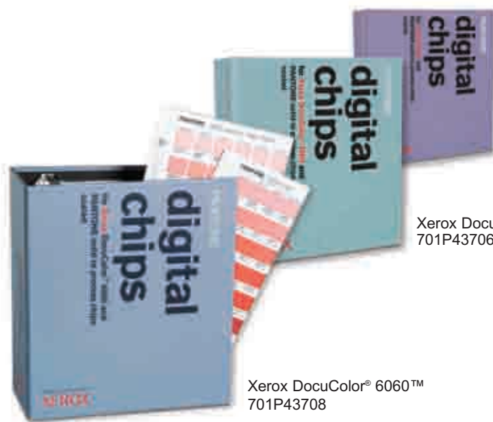
Xerox DocuColor® 6060™ 701P43708