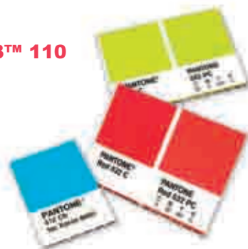
Xerox iGen3™ 110 701P43707