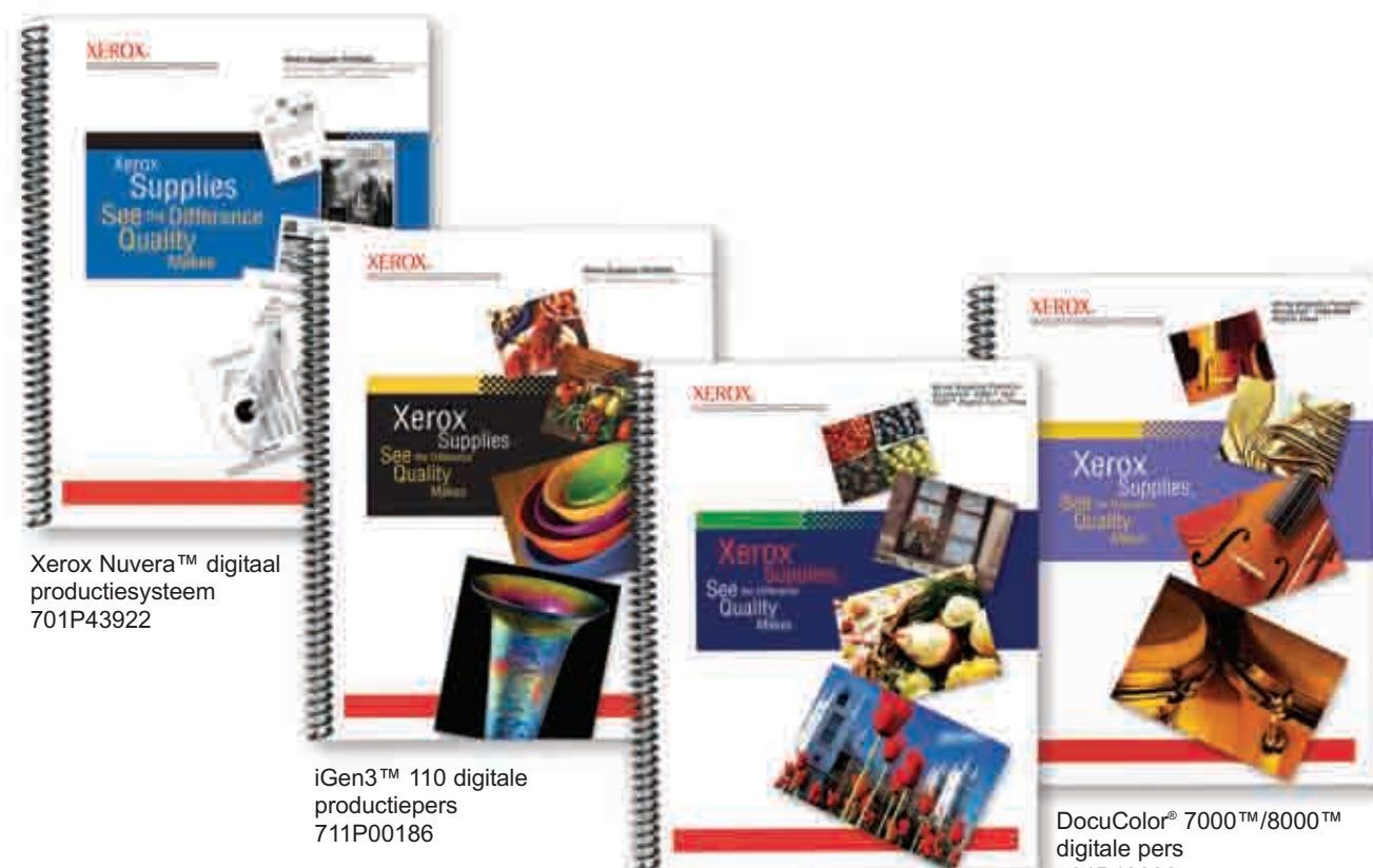
Xerox Nuvera™ digitaal productiesysteem 701P43922