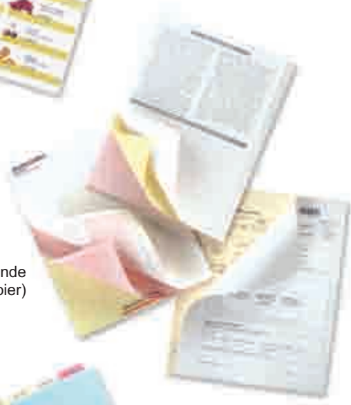
Vorbedrukte, zelfkopiërende oplossingen (NCR papier)