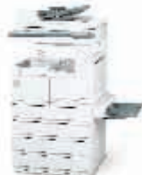
WorkCentre Pro 416DC