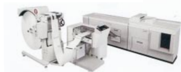
Le système d'alimentation en bobine optionnel fournit jusqu'à 50 000 feuilles découpées... soit jusqu'à 12 heures de production non-stop !