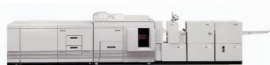
Le Module Xerox BFE optionnel permet la réalisation directe de manuels, rapports, etc. sous forme de cahiers avec agrafage à cheval.